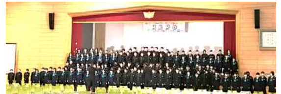
令和4年度 文化祭 全校合唱

4月より新型コロナウイルス感染症対策のためのマスク着用のルールが見直され、生徒及び教職員については、学校教育活動にあたってマスクの着用を求めないことを基本とすることとなりました。生徒同士、生徒と教職員がお互いに顔が見えることで、より気持ちが通じ合うようになると思います。令和5年度を迎えて、生徒たちも教職員も希望を胸に前向きな気持ちでスタートいたします。本校の校歌に「友垣の 緑なる丘」とあるように、生徒同士が友垣（＝友情）を結び、全校生徒と全教職員が心をひとつにして、「かがやき きらめく 緑丘中学校」となるように教育活動に邁進してまいります。