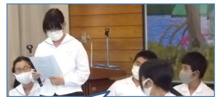
図書委員が司会を務めました！