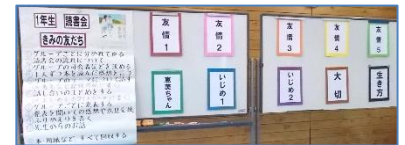
図書委員が司会を務めました！

7月31日(金)多目的室にて、1年生の読書会をしました。10グループに分かれ、それぞれのテーマについて話し合い、発表しました。初めての読書会ということで、最初は緊張している様子も見られましたが、話し合いが進むにつれて笑顔も見られ、活発に発言する様子も多く見られました。読書会でのふりかえりでは、「自分が思いつかなかった意見があった」「より自分の思いや考えが深まった」など他の人の意見を聞いて、気がついたり共感したりという意見が多くありました。その他、「友達について深く考えることができた」「一緒に話をするだけで仲が深まった」という意見もありました。2学期からの人間関係にプラスになるといいですね。