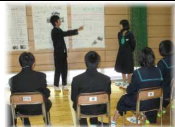
わく・ワーク体験の発表会