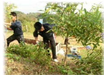
おらっちゃんの森づくり運動ボランティアで参加