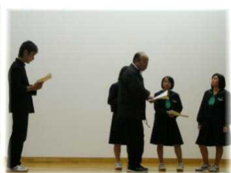
七尾東雲高校酒井先生と生徒による演劇教室