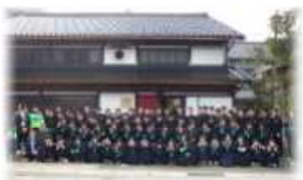
酒米プロジェクト