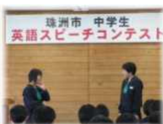
珠洲市スピーチコンテスト