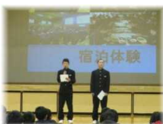
体験入学 2年生による学校説明