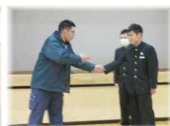
避難訓練(不審者対応) 護身術を学ぶ