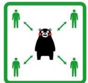
くっつかないモン #KeepDistance