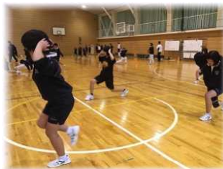
第2回男バスメニュー