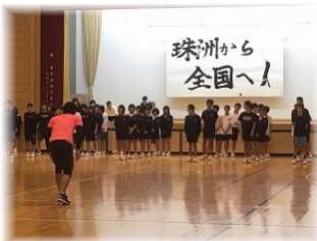
第1回陸上メニュー

冬季の部活動の楽しいイベント、合同トレーニングが行われています。12月17日までに4回行いましたが、各部活動のキャプテンが率先して声を出して頑張っています。合トレの前半は、校内ランニングや補強トレーニングなどを行い、後半は、各部活動のスポーツの特色を生かしたトレーニングを行っています。第3回の女子ソフトテニス部が担当した練習メニューはウォーミングアップが中心でしたが、各々が運動の意味をよく捉えて意欲的に活動していました。合同トレーニングを通してお互いが高め合い、個人やチーム、そして学校全体のレベルアップにつなげましょう。