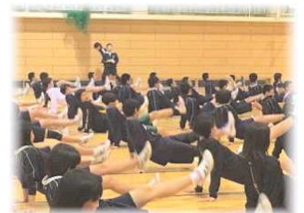
第4回野球メニュー