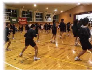
第3回女テニメニュー