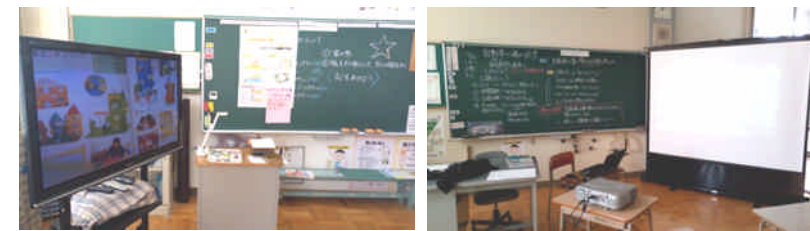
教科書の写真を拡大して提示

今後は、児童自身がパソコンや電子黒板、タブレット端末などを操作しながら学習に活動に取り組む、「主体的な学習活動」となるよう指導を工夫していきます。