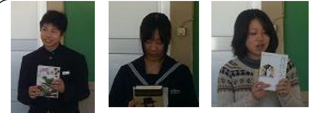
ブックトークは、この3人が行いました

2年生の執行部を中心に後期の生徒会も文化祭を始めとしてしっかりとした活動をしてきました。24年度にもきちんと受け継がれていくものと思います。