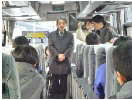
出発式 校長先生のお話