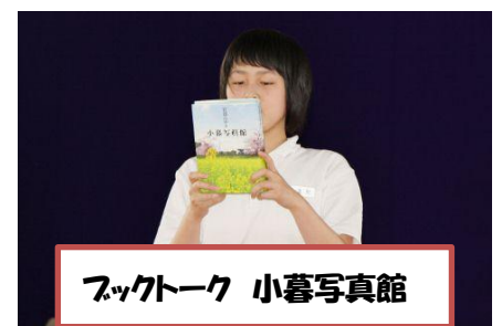
フックトーク 小暮写真館