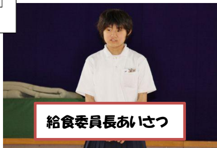
給食委員長あいさつ