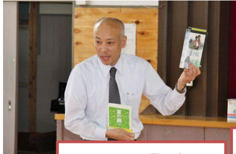
フックトーク 夏の庭