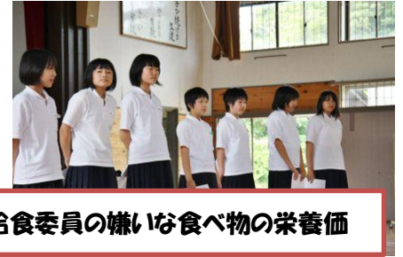
給食委員の嫌いな食べ物の栄養価