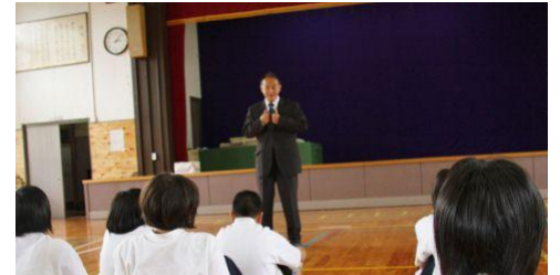
校長先生のお話 グリーンピースが大嫌い