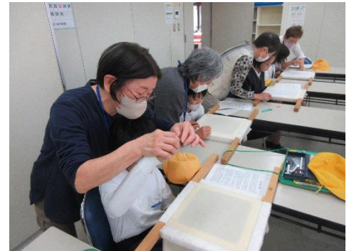
5年 美川産業じまん