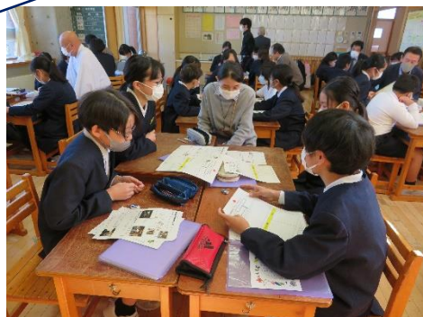
6年 空き家活用 交流