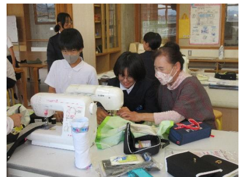
5年 家庭科ミシン支援