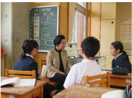
6年 国語 インタビュー