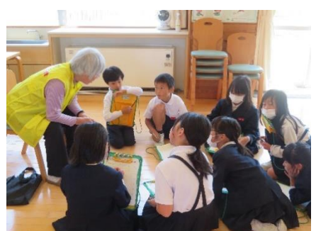
3年 おかえり祭りの話