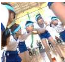
円陣組んで「頑張るぞ！」

室内で行う運動会、「投げる」「走る」「跳ぶ」「力だめし」「リズムダンス」といった様々な運動要素を取り入れ、さらに縦割り班や保護者・地域の方と交流する場もあり、やる人も見る人も楽しめる運動会となりました。5・6年生は、縦割り班のリーダーとして、下級生と団結力を高め、また、道具の準備・片付けや運営でも大活躍し、大きな成長が見られました。