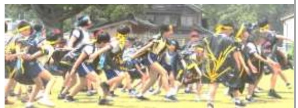
よさこい「南中ソーラン」