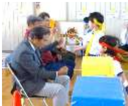
地域の方とじゃんけん