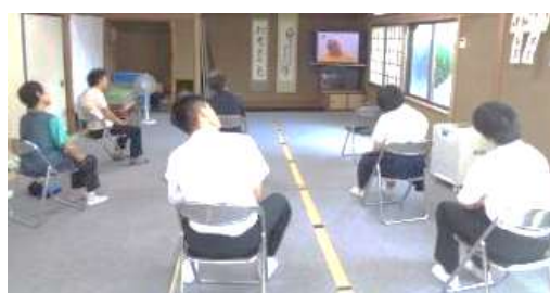
9/17 公民館で高齢者と「いきいき体操」（中3）