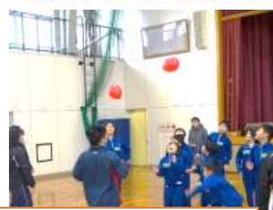
2/27小中合同交流「じゃんけんピラミッド」と「風船バレー」