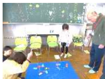
12/17 地域の人とお楽しみ会（小1）