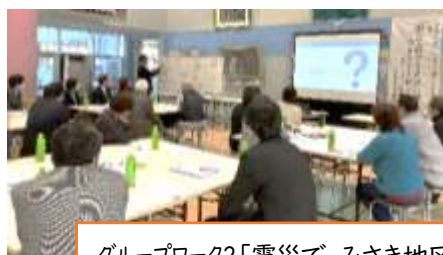
グループワーク2「震災で、みさき地区はどうか変わった？」