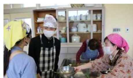
1/28 地域の人と伝統食（赤飯）づくり（中1）