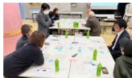
グループワーク3「ネガティブをポジティブに言い換えてみよう！」

気を張ることなく受講することができました。震災後の子どもたちが身体を十分に使った活動が増えていくことを願っています。「ポジティブ・チェンジ」をいつも心に秘めて1日1日を過ごします。(地域)