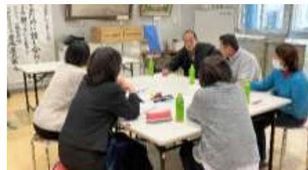
グループワーク1「2つの写真から間違い探し！」

ポジティブに考えることで、子どもたちにも未来ある珠洲と一緒に作っていきたいと思いました。来て良かったです。(保護者)