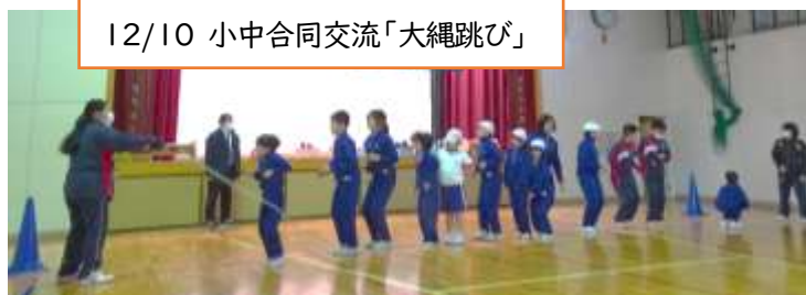
12/10 小中合同交流「大縄跳び」