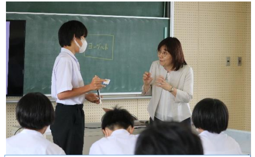
6/26 ホワイトボードミーティング学習会より

この日は、各方面からいただいているたくさんの支援に対して、「どのように感謝を伝えるか」というテーマで話し合いをしました。私たちは元日の発災以降、日本全国から物資面だけでなく応援メッセージなど、心に寄り添った数えきれないくらいの支援をいただいています。学校生活も少しずつ落ち着いてきた今、生徒たちから支援に対して元気であることの返事をしたいとの声があがりました。先日学習したホワイトボードミーティングの手法を使って意見を出し合いまとめていく姿からは、意見を可視化することでより考えが深まっていく様子が見られました。全校生徒でアイデアを出し合い、三崎中らしい感謝の気持ちを伝える方法について、今後は生徒会を中心に具体的に活動を始めていく予定です。