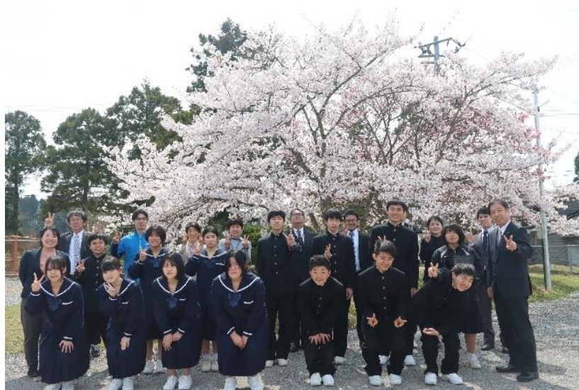
全員による記念撮影です

震災の影響は大きいですが、震災だから無理だとあきらめるのではなく、できることは何だろうかと考えることで、新たな活動ができると思います。震災を通して人の温かさを改めて実感したように、震災をマイナスとしてとらえるのではなく、震災の経験を次に生かすことができる一年にできればと思っています。職員一同、校訓である「自主・親和・責任」の実現に向けて努めるとともに、三崎、珠洲の復興に向けて少しでも貢献できるよう、努めていきたいと思っています。保護者の皆様、地域の皆様には、今後ともご支援、ご協力の程、どうぞよろしくお願いいたします。