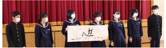
2年生の学年目標「eight power yeah」