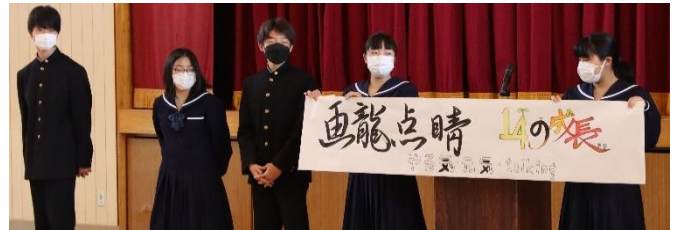
3年生の学年目標「画龍点睛 14の成長」