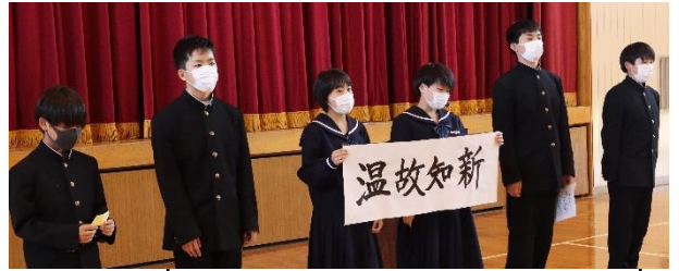
1年生の学年目標「温故知新」

また、各学年、部活動ごとの目標の発表では一人一人がしっかりと大きな声で発表をしていました。各学年の発表は、学年のメンバー全員が前に出て、目標とその設定理由をわかりやすく伝えました。部活動の発表では、チームとしての目標はもちろん、一人一人が自分で決めた目標をしっかりと発表しました。