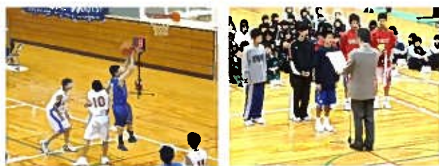
(試合で活躍する本校生徒と表彰式の様子)

☆ 能登地区中学校選抜バレーボール大会 <11/22 中能登中学校体育館> 男子 準優勝