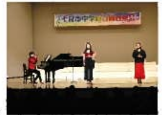
(「VOX OF JOY」の皆さん)