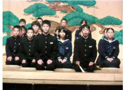
(素謡「狸々」を発表したグループ)

11月5日(土)七尾サンライフプラザにおいて標記能楽大会が開催され、その番組の一部に七尾こども能楽教室発表会として、小丸山小学校5年生と御祓中学校1年生も参加させていただきました。