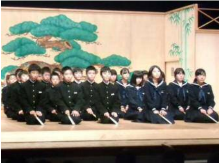
(連吟「狸々」を発表したグループ)

11月5日(土)七尾サンライフプラザにおいて標記能楽大会が開催され、その番組の一部に七尾こども能楽教室発表会として、小丸山小学校5年生と御祓中学校1年生も参加させていただきました。