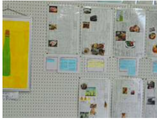
(生徒作品展示：1年地域の特産物新聞， 美術工芸部の作品， しんちゃんコーナー)