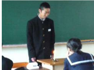
(幸運を願う「ろうそく消し」)

本校では竹田図書館司書が生徒の読書指導に積極的に取り組んでおり、「おはなし会」の他に、様々な分野の本に興味を持ってもらおうと七尾市立図書館司書を招いた「ブックトーク(11/17,12/12)」も企画運営し、生徒の読書活動の推進に努めています。