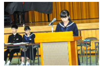
(任命式での後期執行部) (総会で方針を述べる会長) (委員会に質問する生徒) (質問に答弁する委員長)