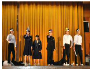
(ゴレンジャーVSジョッカー)