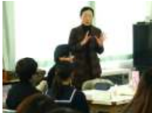
(学校薬剤師・生活安全課署員・健康推進課職員の方々からのご助言)