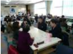
(グループで意見交換)

今回は、「御祓中学生の睡眠事情」というテーマで取り組みました。保健委員が委員会活動で取り組んできた生活アンケート結果を基にまとめた内容を問題提起としてプレゼン発表し、6グループに分かれて意見交換をしました。その後、学校薬剤師・生活安全課署員・健康推進課職員の方々に専門的立場からご助言をいただきました。参加いただいた地域の方々には、中学生と直接会話することで現状把握の機会としていただき、生徒にとっては保護者や地域の方々から温かく見守られていることを実感できる有意義な機会となりました。