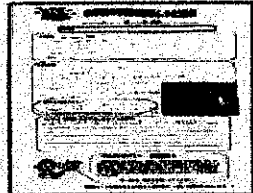
(保護者から集まったレシピ)

そこで、第2部会で、家庭で簡単に作られる料理やおやつ「我が家の手軽で簡単レシピ」を保護者の皆さんに募集したところ、なんと70点を超えるレシピが集まりました。今回は数が多かったのですが、とりあえずその中の30点をレシピ集に編集して全生徒に配布しています。今回レシピ集にできなかったものは第2号のレシピ集の中で紹介されるそうです。また、レシピ集の後ろのページには作ってみた感想や第2弾のレシピ集の募集中紙などもつけられており、保護者の方の反応もすごく気になるところです。これをきっかけに少しでも朝食内容が改善されればうれしいですね。