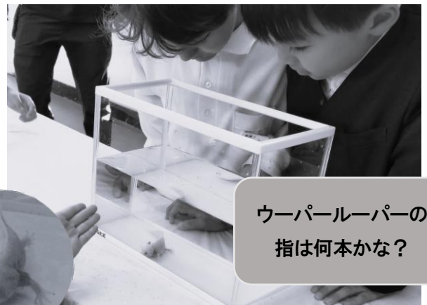
ウーパールーパーの 指は何本かな？