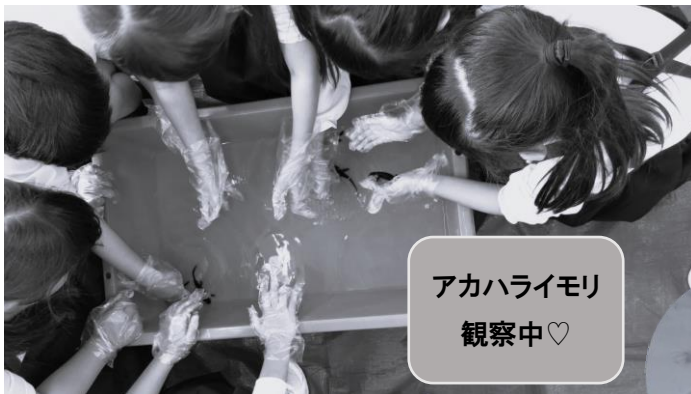
アカハライモリ 観察中♡