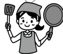
調理実習のボランティアさんより