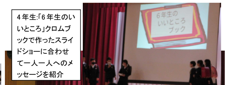
4年生:「6年生のいいところ」クロムブックで作ったスライドショーに合わせて一人一人へのメッセージを紹介