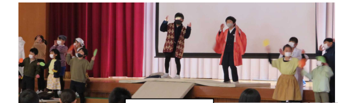
3年生:「3年とうげ」6年生が3年前に披露した劇のリバイバル！