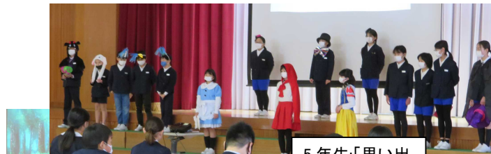
5年生:「思い出ぼうけん物語」6年生の思い出を辿ります。準備・進行もよく頑張りました！