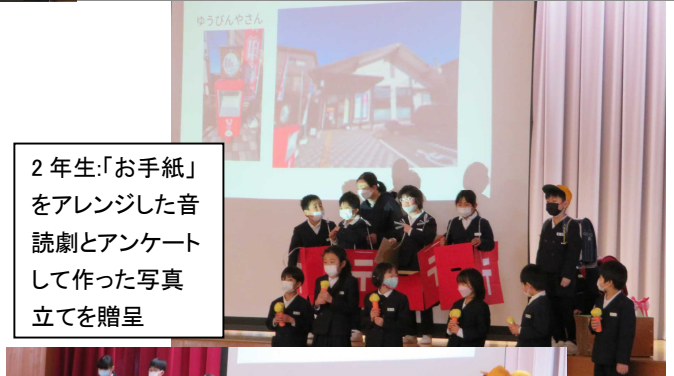
2年生:「お手紙」をアレンジした音読劇とアンケートして作った写真立てを贈呈