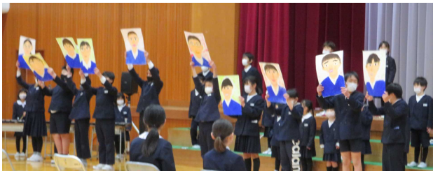
1年生:そっくりの似顔絵プレゼントとキラキラ星の合奏披露

体育館渡り廊下には、各学年から6年生に向けたメッセージ！ 体育館に飾られた風船にも、一人一人の名前とエールが☆