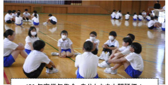
456年高学年集会:自分たちを中間評価!