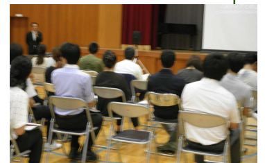
依存症になると「脳」にも影響が