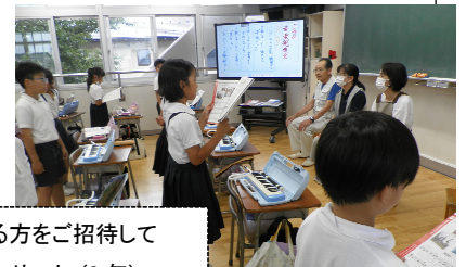
日頃お世話になっている方をご招待して感謝を伝える「ミニコンサート」(3年)