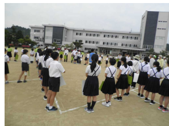
(文責 山森 久代)

6月8日(木)創立150周年記念事業の一つとして「航空写真」撮影を行いました。デザインの原画は6年生から応募し、「150」「校章」「みーやん」が記されたものです。子どもたちと職員、そして、保護者・地域の方々の代表として、PTA役員会・学校運営協議会・150周年記念事業関係者の方々にご協力いただき、校章のペンの部分を形どりしました。(その他の部分はCG) ドローンによる撮影は、殆どの方が初めての経験で、最新の小さな機械に大きな未来への夢を託すひと時になりました。 今後、全児童がそろった日に集合写真を撮りたいと思います。