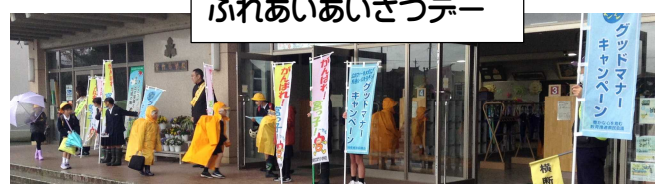
ふれあいあいさつデー