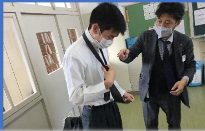
社会人に向けて準備万端!!