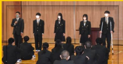
前生徒会役員の皆さん