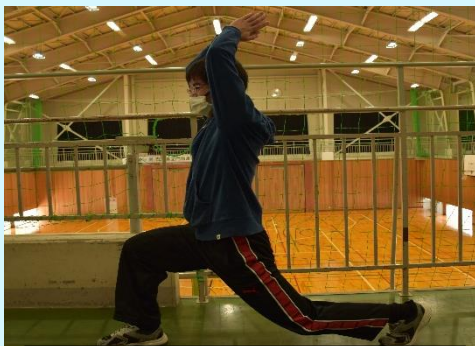
三日月のポーズをキメる風先生