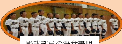
野球部員の決意表明