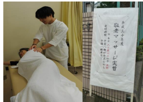
敬老マッサージ実習