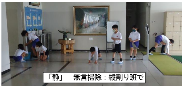
「静」 無言掃除：縦割り班で

さらにもう一步、将来へ目を向け、周囲の状況に応じて、自分の行動を考えられる自己決定力を身に付け、たくましい人間に成長することを願っています。