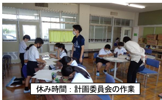
休み時間：計画委員会の作業

日々の学校生活の中では、うまくいって楽しい日もあれば、調子が悪い日や、指導することが多い日もありますが、相手のことを認めながら行動するということは、必ず良い方向へ向かうはずです。