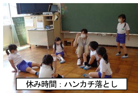
休み時間：ハンカチ落とし

子どもたちの学習意欲に答えるべく、先生方も熱心に教材研究をして分かりやすい、楽しい授業に備えています。学習面だけではなく、子どもたちの気持ちに寄り添いたいという思いのもと、定期的に「心のアンケート」も実施しています。休み時間も子どもたちと一緒に遊んだり、教室で過ごしたりしています。授業で子どもたちの学習状況をしっかりと見るのはもちろんのことですが、先生方が休み時間も子どもたちと共に遊んだり作業したり