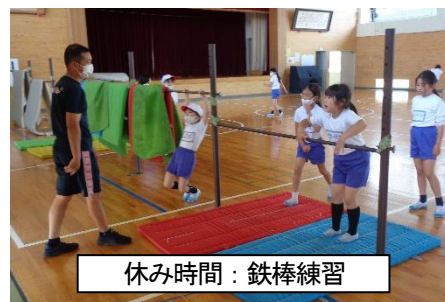
休み時間：鉄棒練習

子どもたちが、がんばりがいを感じて学ぼうという態度や、純粋な気持ちで掃除や係の仕事に取り組む姿に対して、改めて我々教職員がやりがいを感じて、精一杯の指導、支援、理解をしていかなければならないということを、最近の子どもたちの様子から感じた次第です。