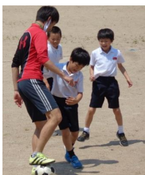
休み時間：サッカー

6月中旬に梅雨入りしたというものの、これまでは大きな天候のくずれはありませんでしたが、この後下旬には、雨の予報が出ているようです。学習や遊びに励む子どもたちの様子は、徐々に夏服姿に変わってきました。教室のエアコンや体育館の大型冷風機も今後、本格稼働予定です。熱中症対策としての冷房と、コロナ対策としての換気に併せて取り組んでいきたいと思ひます。