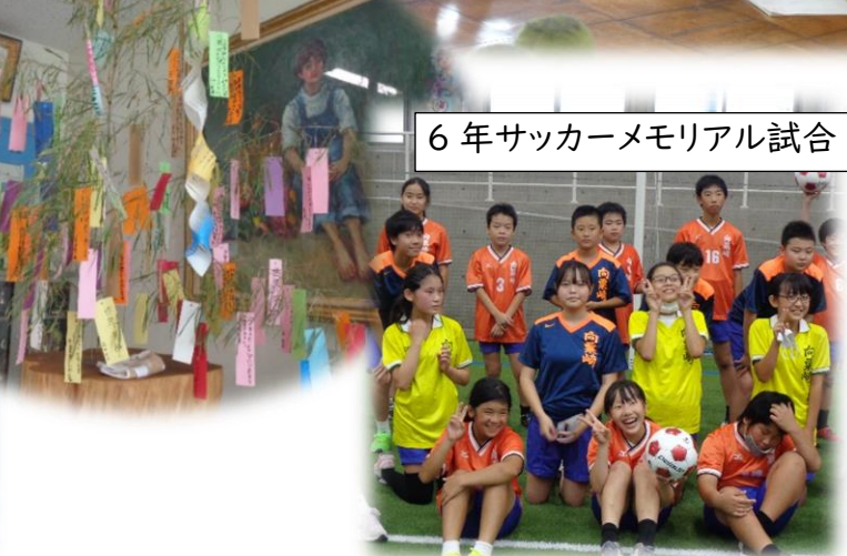
6年サッカーメモリアル試合