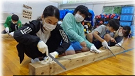
自然体験学習～焼き杉クラフト～