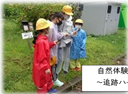
自然体験学習 ～追跡ハイク～