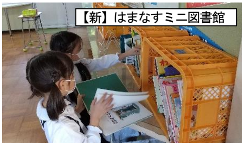
【新】はまなすミニ図書館

館」の取組がありました。教室の近くに図書室の本を置いて、いつでも借りて、本に親しめるようにした工夫です。もちろん、これまでも図書室で本の貸し出しをしていたのですが、なかなか本を借りられなかったり、決まった分野の本だけを借りたりすることがありました。いつも行っている読書活動ですが、今回の「はまなすミニ図書館」の取組も効果的だと思います。