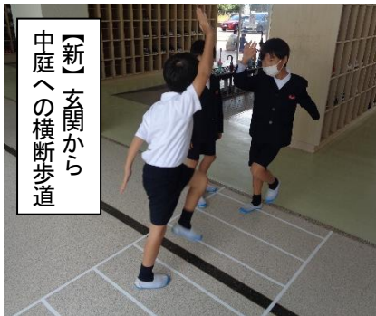
【新】玄関から中庭への横断歩道

新しいアイデアを盛り込んだり、新たなキャッチフレーズを掲げたり、子どもたちが意識するように工夫しています。