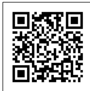
向粟崎小学校ホームページ QRコード

今後も学校の重点的な取組に関する項目について、よりよい学校運営に活かすため調査をさせていただきたく、ご協力いただけるとありがたいです。なお、お子様の普段の様子からどうしても評価しにくい場合は、「判断できない」とご回答いただいても結構です。