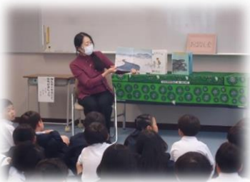
がらがらどんさんのお話会