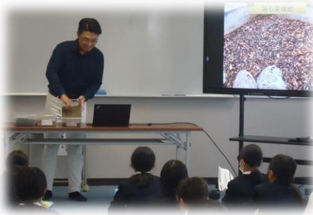
ゲストティーチャーとの交流学习