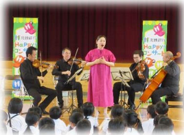
北國ハッピーコンサート