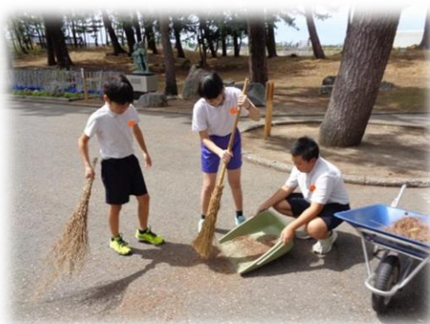
ボランティア清掃