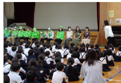
ボランティアさんの紹介式