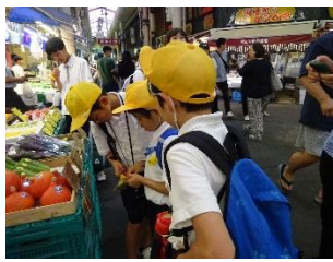
近江町市場で買い物体験