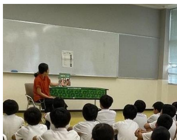
がらがらどんさんおはなし会