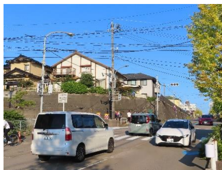
登校時のアカシア交差点

通学路の交通安全については、これまでも話題にあがっており、学校としても折にふれ指導を重ねてきました。しかしながら、アカシア交差点では、まだまだ子供たちの危険な行動が気になるというご意見をいただきました。子供たちにはしっかりと安全指導を行い、自分の命は自分で守るという意識を身に付けさせたいと思います。ご家庭におかれましても、機会あるごとにお子様の安全について、話し合っただけると幸いです。