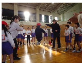
全校で取り組んだ なわとび運動