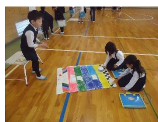
2年生が1年生をご招待! 「おもちゃランド」