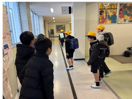
3学期のスタート 計画委員によるあいさつ運動

また、課題として見えてきたものに、睡眠時刻や家庭学習があります。今年度は、児童の生活面の取組として睡眠にスポットを当て、外部講師を招いての講演会や、メディアコントロールの取組を行いました。特に、授業参観に併せて行った睡眠講話では、