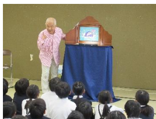
のまりんの紙芝居