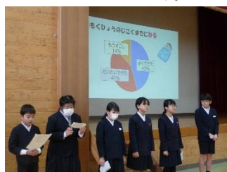
保健委員会 睡眠について集会で発表