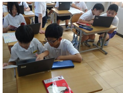
タブレットを使って