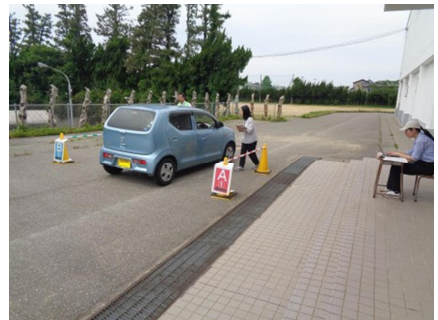
児童引き渡し訓練