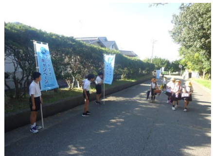
グッドマナーキャンペーン