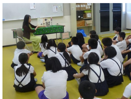
「がらがらどん」さんおはなし会