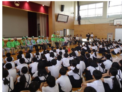
ボランティア紹介式