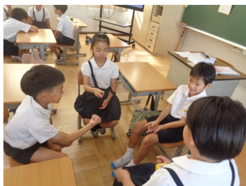
朝学習の時間「アドジャン」で友達づくり

また、子供たちの認め合う人間関係づくりのための、「ナイススター」や「アドジャン」などの取組によって、児童の自己肯定感の向上や認め合う人間関係の育ちが見られるようになりました。児童アンケートでは9割以上の子が、「友達から認められている」「友達のがんばりを認めている」と回答しています。学校全体で、お互いを認め合い、思いやる態度が育つよう、今後もいろいろな機会に豊かな心を育む働きかけをしていきたいと考えています。