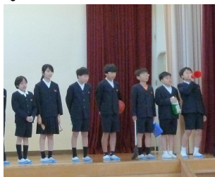
児童集会で抱負を述べる新委員長

新しい委員会に変わったため、曜日ごとの当番を確認したり、仕事の内容を覚えたりしてやる気いっぱいの5、6年生。アイディアを出し合い、全校のみんなを楽しませるイベントを企画している委員会もあって、後期の向小も楽しみです。