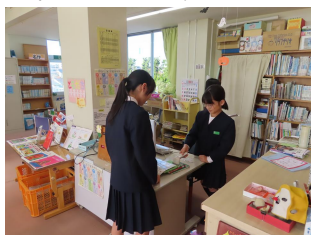
本の貸出の仕事をする新図書委員