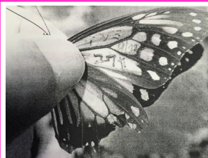
13. 輪島から飛来の「ナジミ ユウカ」マーク蝶

さんがマーキングしたアサギマダラが屋久島で再観察され、その方から報告書が届きました。今年度もアサギマダラのマーキングに取り組んで全国に発信していきます。