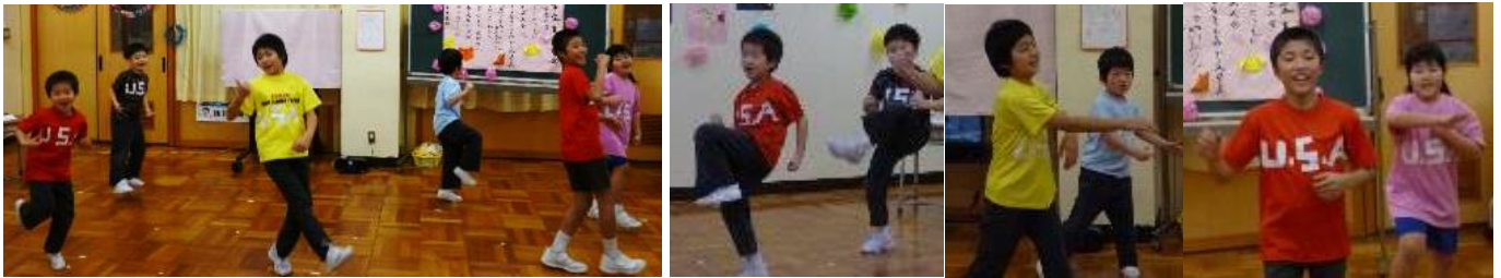
【1~5年生 歌「思い出のアルバム～南志見バージョン～」とプレゼント渡し】