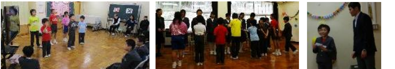
【6年生から後輩たちへ】