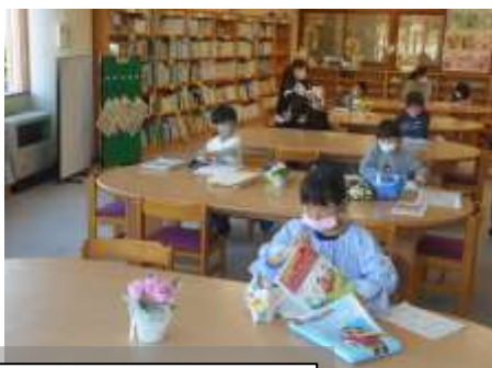
さて 勉強頑張ろう！