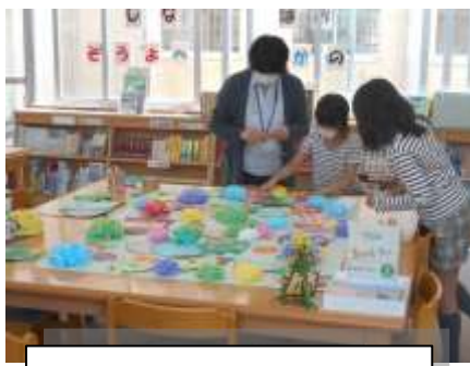
司書の仕事を手伝います！