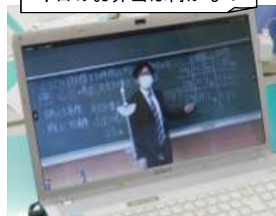
「しくじり佐原先生」の動画！ HPで好評配信中です