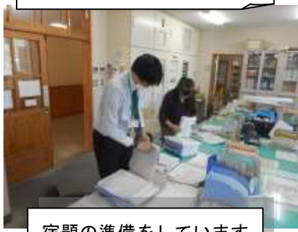
宿題の準備をしています