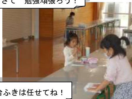
台ふきは任せてね！