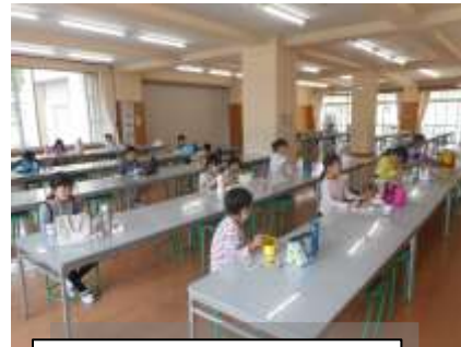
今日のお弁当は何か？