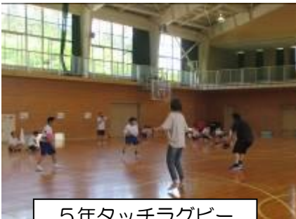
5年タッチラグビー