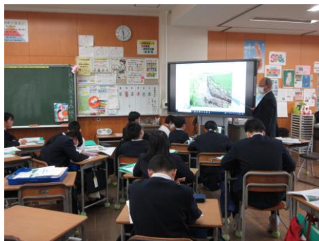
特別栽培米についての学習