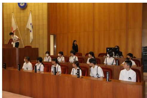
議場見学・議会体験