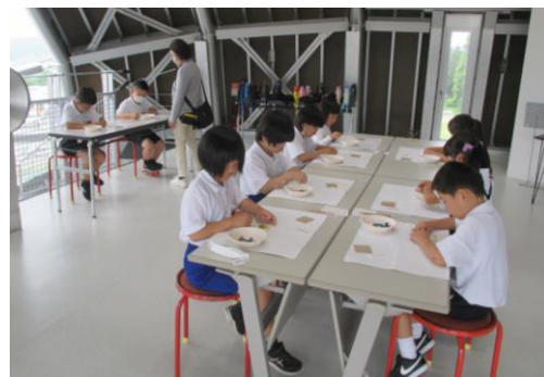
ガラス美術館見学・ガラス工芸体験