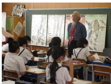
トキについての学習