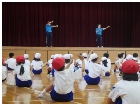
イヤサカなかじま踊り指導