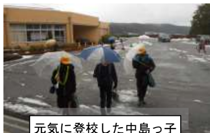
元気に登校した中島っ子

新しい年を迎えました。昨年は新型コロナウイルス感染症拡大防止に向けて、手洗いと消毒、マスクの着用、そして3密回避等新しい生活様式が求められ、臨時休業を経て学校が再開されました。子ども達は不自由で制限を強いられる状況の中、心身ともに健康で、学習や運動によく頑張りました。新型コロナウイルスの収束には程遠く、まだまだ先が見えない状況です。今後も引き続き、感染症対策の徹底をお願いします。