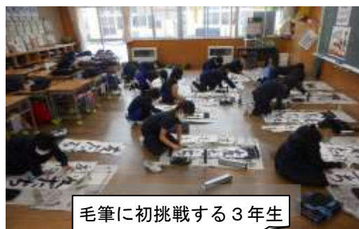
毛筆に初挑戦する3年生

作品の展示は、8日(金)、12日(火)、13日(水)、14日(木)の16:30~17:30、場所は各学年の廊下です。なお、入校の際は、マスクの着用とアルコール消毒、玄関に設置してあるサーモグラフィ画像での検温と受付名簿の記載等、感染症防止対策のご協力をお願い致します。また誠に勝手ながら、来校は保護者1名に限定させていただきます。