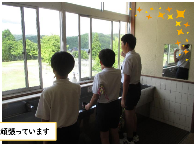
みんな歯みがき頑張っています