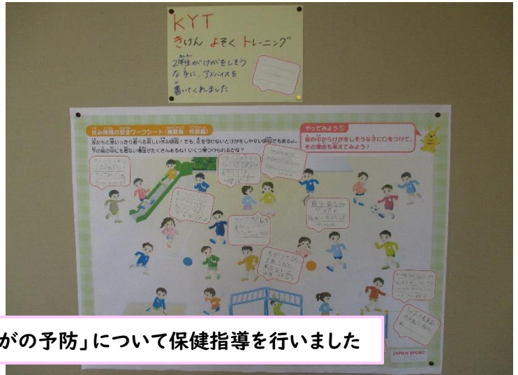
身体測定の後には、「給食後の歯みがき」「けがの予防」について保健指導を行いました