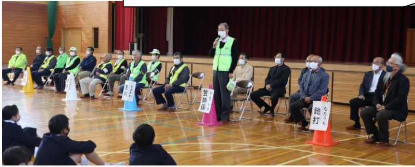
自己紹介をするサポート隊の皆さんと代表挨拶をする6年生